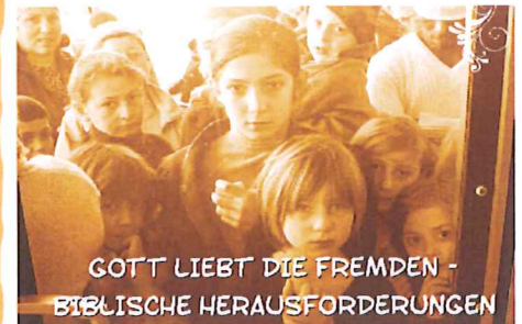
GOTT LIEBT DIE FREMDEN - BIBLISCHE HERAUSFORDERUNGEN

Kontakt und Voranmeldung für das Essen: W. Kippenberger, Tel: 06 21 / 66 95 18