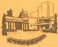
Gemeinde St. Albert