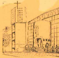
Gemeinde Maria Königin