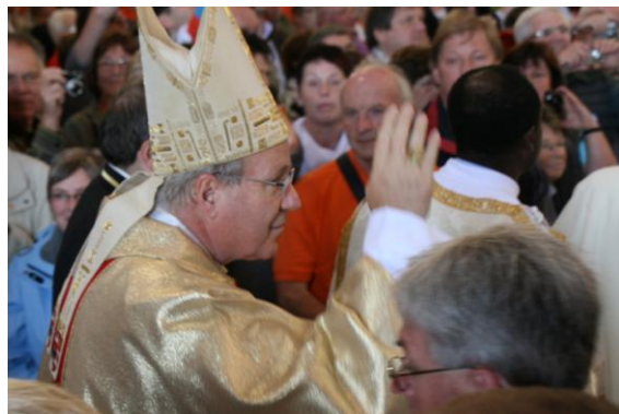
Kardinal Schönborn beim Abschlussgottesdienst in der Lateranbasilika.

dung, ohne die man jungen Menschen nicht helfen könne. Der „Tyrannei der Toleranz“ müssten sie sich entgegenstellen und beherzt den christlichen Standpunkt in der Öffentlichkeit vertreten. Und zuletzt rief er die Kolpingmitglieder dazu auf, in „kritischer Loyalität“ die Einheit mit der Kirche zu wahren.