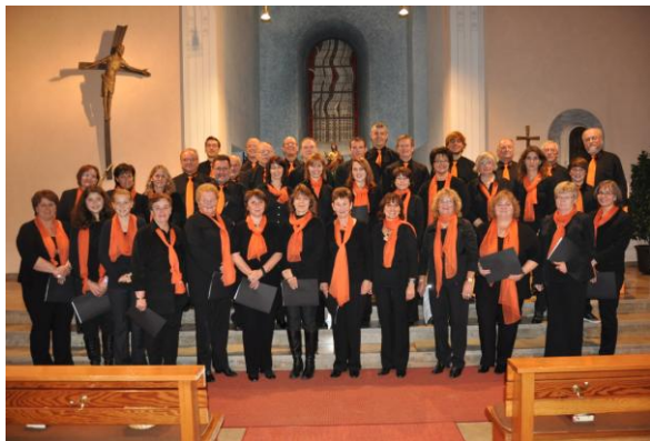
Der Projektchor der Kolpingfamilie Obermohr nach seinem ersten Auftritt.